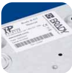
Műszaki adatokat tartalmazó jelölések