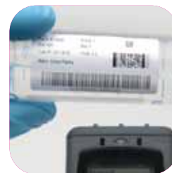
Laboratóriumi és egészségügyi azonosító címkék