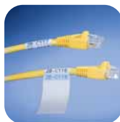
Huzalok és kábelek azonosítása