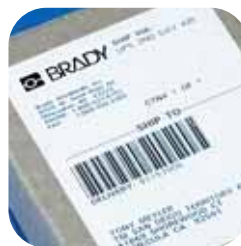
Követelményeket kielégítő szállítást igazoló címkék